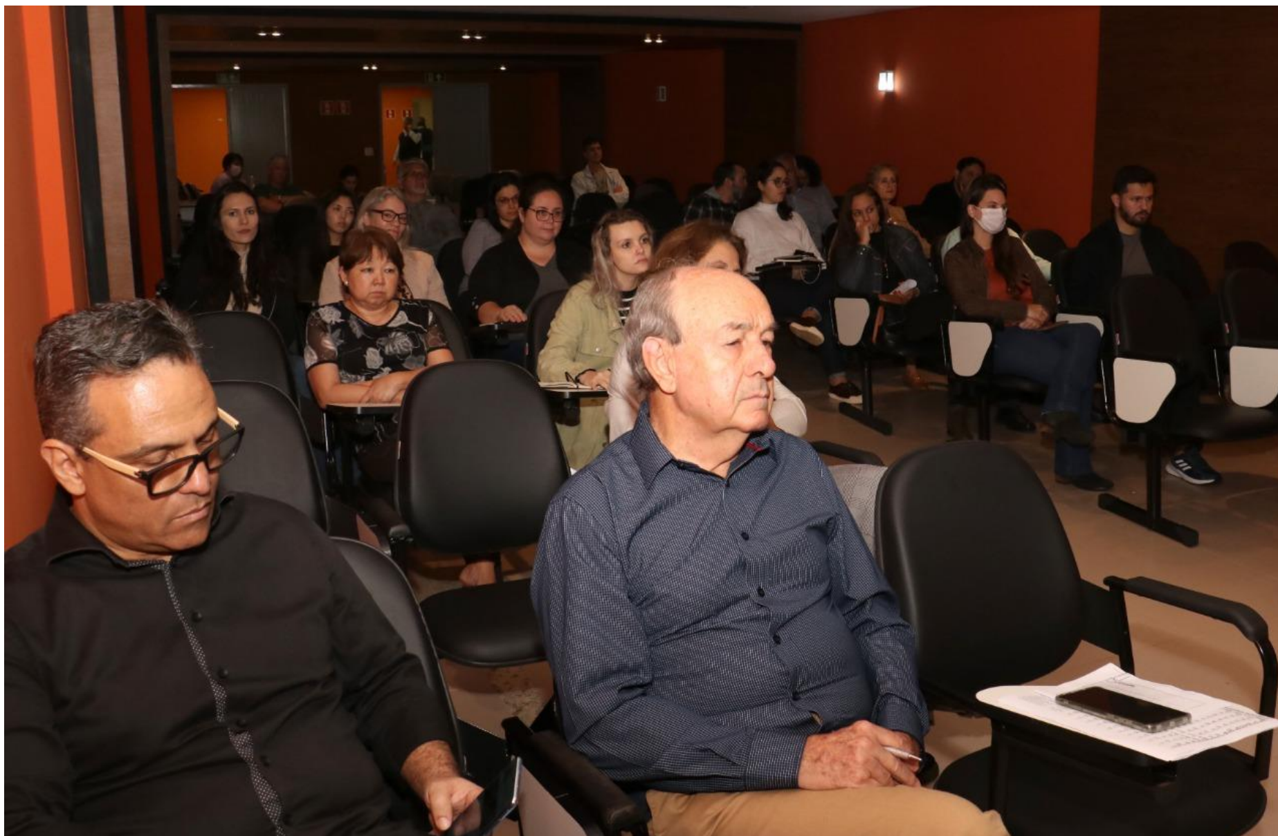
AUDIÊNCIA PÚBLICA PREVIDÊNCIA SOCIAL RPPS – realizada no dia 14/09/2022, 14h, auditório da CAAPSM