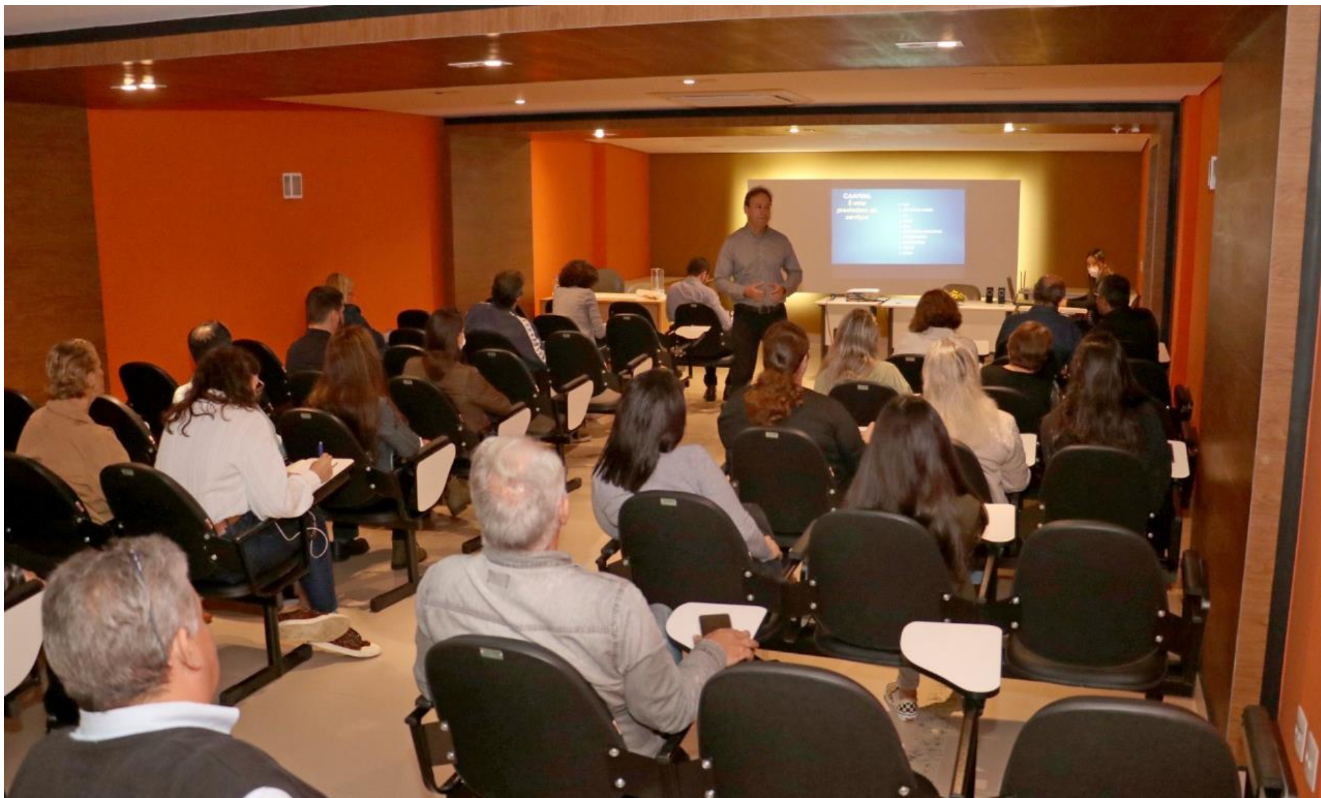
Público presente – 33 pessoas